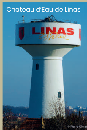
Chateau d'Eau de Linas