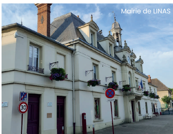
Mairie de LINAS

En définitive, Linas conjugue un certain art de vivre et une facilité d'accès à Paris et propose un équilibre de vie idéale entre ville et nature.