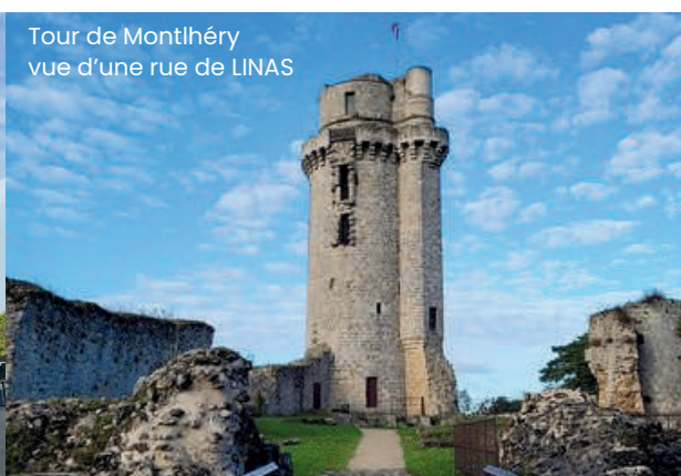
Tour de Montlhéry vue d'une rue de LINAS