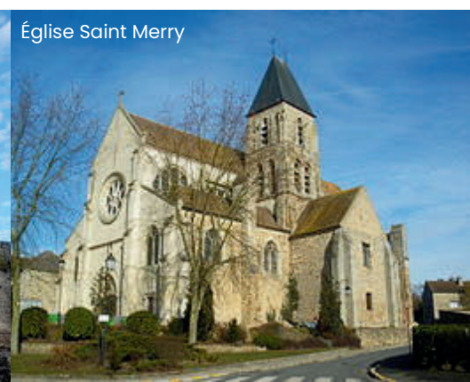
Église Saint Merry