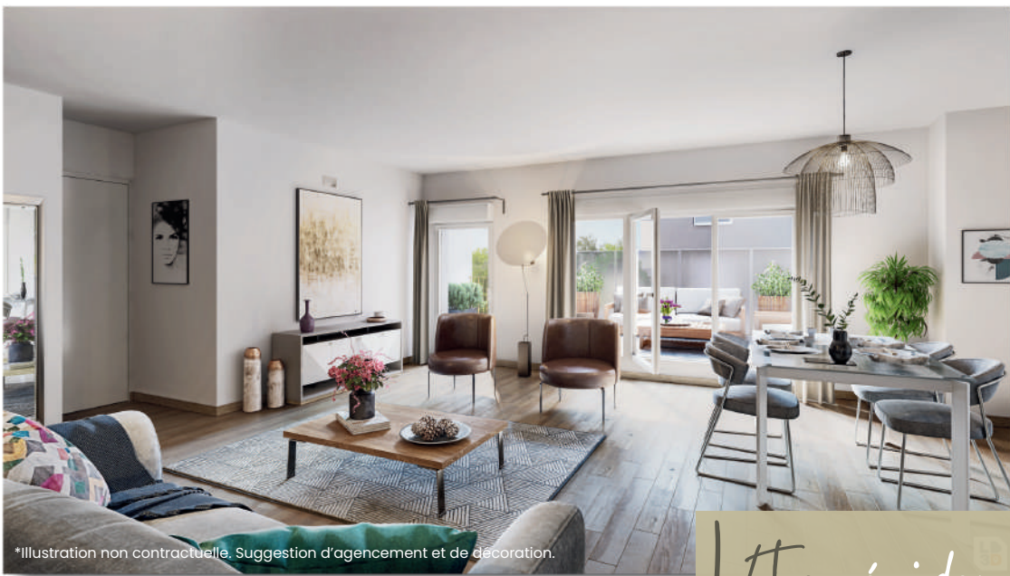
*Illustration non contractuelle. Suggestion d'agencement et de décoration.