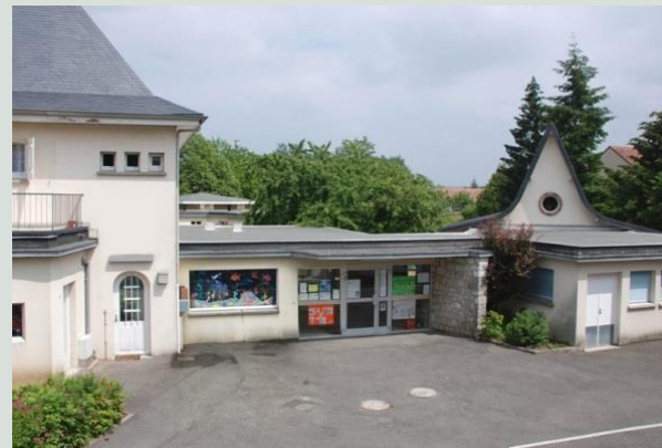
Ecole Clos Saint-Jean.