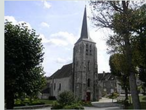
L'église saint-Pierre-Saint Paul.