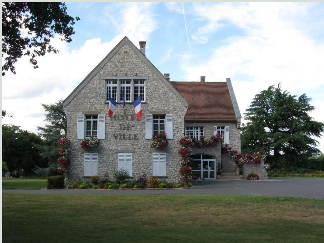
L'Hôtel de Ville.