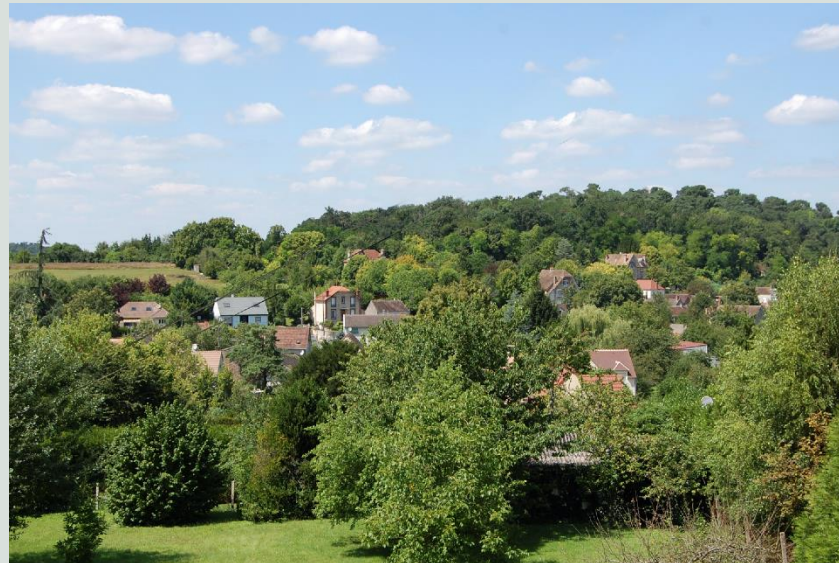
Paysage Saint-Pierre lès-Nemours.

Si la productivité agricole de la Seine-et-Marne se situe dans le peloton de tête des départements français, le département enregistre un double phénomène de disparition des terres cultivables (près de 2 000 ha par an dans les années 1980, moins dans les années 2000) et de réduction d'environ 30 % du nombre d'agriculteurs dans les années 2010. Cette tendance se retrouve au niveau de la commune où le nombre d'exploitations est passé de 10 en 1988 à 5 en 2010. Parallèlement, la taille de ces exploitations augmente, passant de 68 ha en 1988 à 71 ha en 2010.