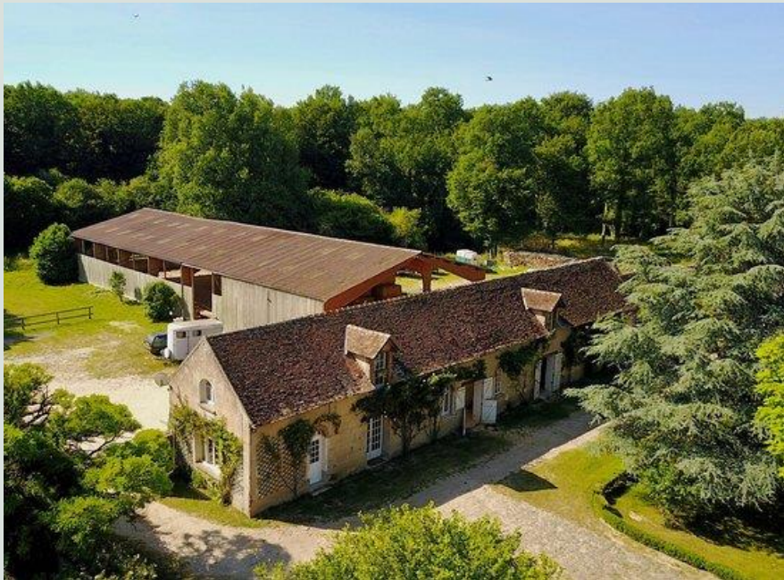
Centre équestre de la commanderie de Saint-Pierre-lès-Nemours

Le développement se fit ensuite des deux côtés de la rivière, sa partie la plus importante restant celle des pentes de la rive gauche. Des sarcophages datant probablement de l'époque mérovingienne, mis au jour en 1895 et en 1956, montrent que le site de Saint-Pierre fut à l'origine de l'agglomération nemourienne. Il porta d'ailleurs, au cours des âges, diverses appellations, qui rappellent l'étymologie du nom : Nemausus, Nemus, Nemoracum. Puis, au commencement du XIII e siècle, il fut érigé en paroisse et une église y fut édifée, Saint-Père de Nemox, consacrée plus tard officiellement à Saint-Pierre par le pape Alexandre III, et qui fut dite alors : Ecclesiam de Nemosio , ce qui la désignait comme l'église de la communauté tout entière. Un établissement monastique, l'abbaye de la Joie-lès-Nemours, y avait été fondé, tandis que la cité prenait de l'importance et qu'un château y était érigé par les seigneurs locaux, en bordure de la rivière, près du gué,