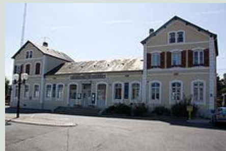
La gare SNCF Transilien de Nemours Saint-Pierre.