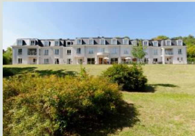
EPHAD et maisons de retraite.