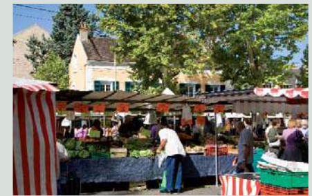
Le marché bi-hebdomadaire.