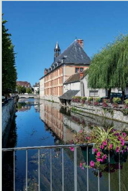
L'Hôtel de Ville.