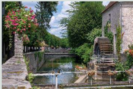
L'Hôtel de Ville.