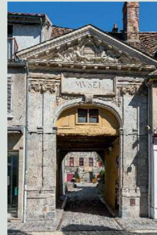
Le porche du Musée.

B lottie dans les bras du Loing, Nemours séduit par sa situation enviable à seulement une heure de train de Paris et a conservé le cachet d'une cité médiévale en cultivant une "ambiance village" qui attire ceux qui souhaitent s'évader de l'agitation urbaine. Riche de son passé historique qui remonte à la préhistoire et fière de son patrimoine classé, l'ancienne capitale du Gâtinais a conservé de nombreux vestiges architecturaux remarquables qui en font sa réputation. Ainsi le Château-Musée datant du XII e siècle, l'ancien Hospice devenu l'actuel Hôtel de Ville, les maisons anciennes, le charme des ruelles, les vieilles places pavées, l'église Saint-Jean Baptiste bâtie à partir de 1170 et le Musée de la Préhistoire combleront les amateurs de vieilles pierres . Sous le signe de l'eau et des espaces verts, avec la forêt de Fontainebleau à 17 km, nombreuses sont les promenades et les découvertes à faire. Le tronçon de l'Eurovéloroute (reliant Trondheim en Norvège à St Jean de Compostelle) longe le canal du Loing sur 35 km et vous invite à la flânerie et au jogging. Sans oublier les activités nautiques comme la pêche et le canoë kayak.