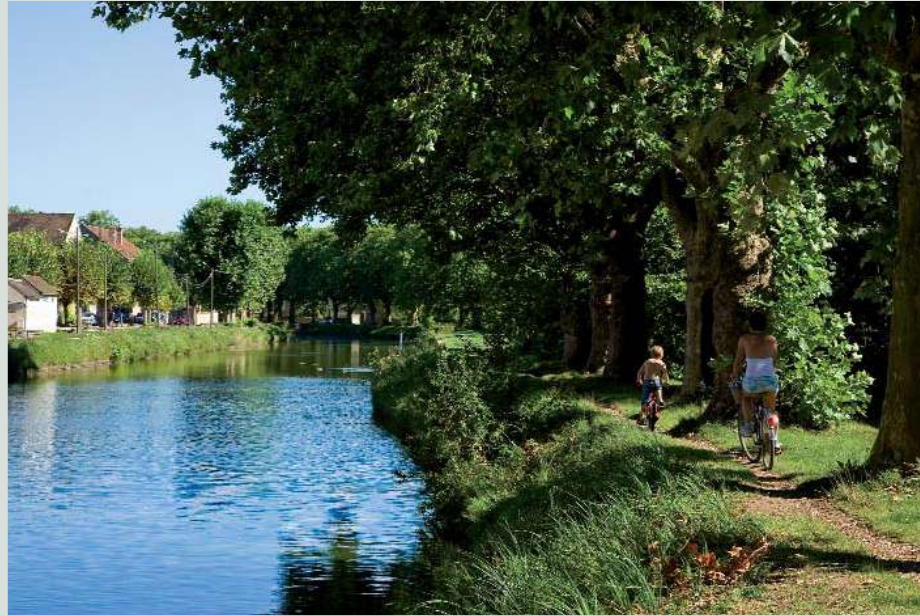
Promenades le long du canal du Loing.

C'est sur les hauteurs de Nemours, dans un cadre de vie unique à deux pas de l'Hôtel de Ville et du centre ville, que le Groupe Saint-Germain a choisi de réaliser la "Résidence Belvédère".