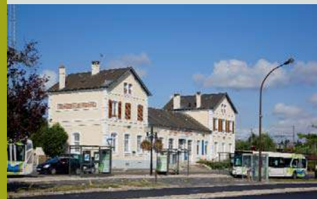
La gare SNCF Transilien de Nemours Saint-Pierre.