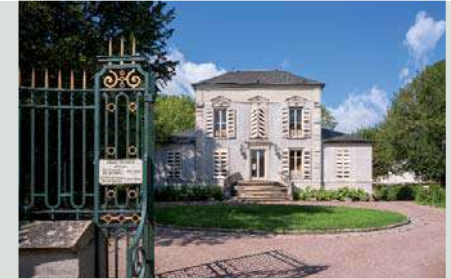
Le Parc Guedu.