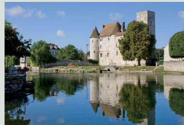
Le château et les bords du Loing.