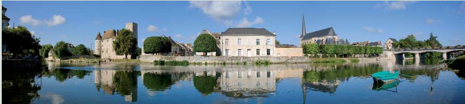
Le Loing avec le château-Musée, le centre historique et l'église Saint-Jean Baptiste pour panorama...