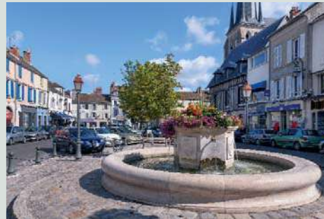
La Place de la République.